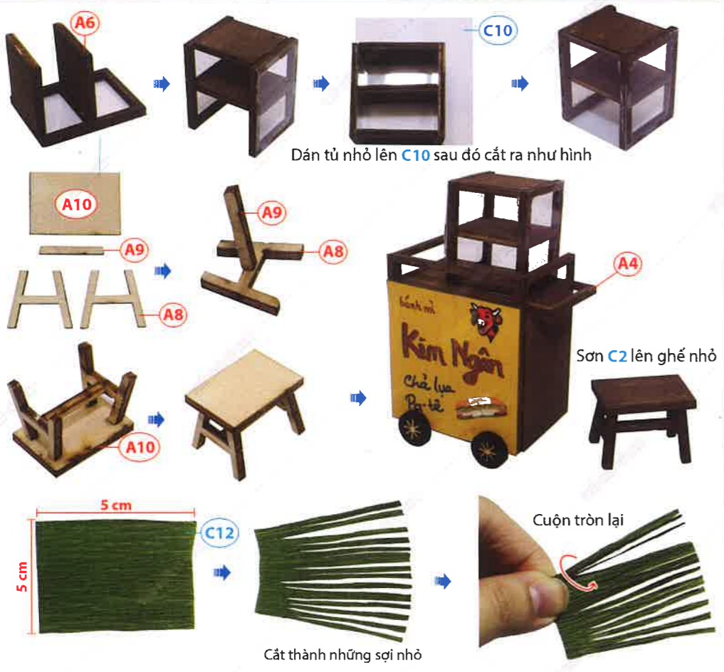
Cắt thành những sợi nhỏ